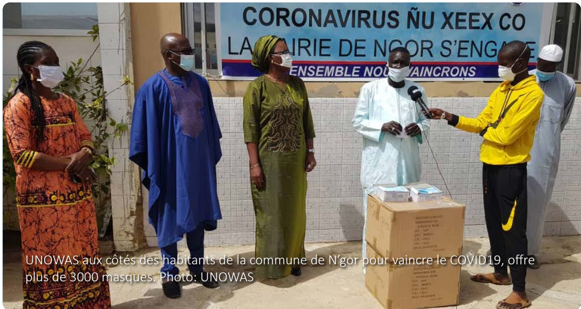
UNOWAS aux côtés des habitants de la commune de N'gor pour vaincre le COVID19, offre plus de 3000 masques.