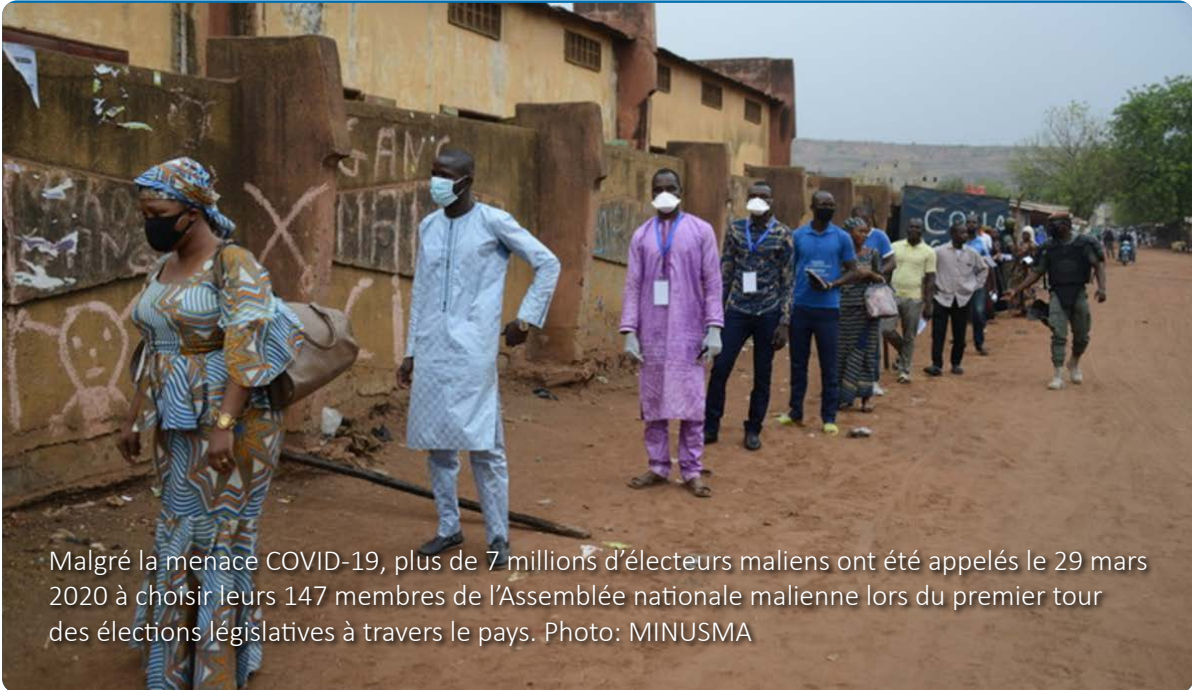
Malgré la menace COVID-19, plus de 7 millions d'électeurs maliens ont été appelés le 29 mars 2020 à choisir leurs 147 membres de l'Assemblée nationale malienne lors du premier tour des élections législatives à travers le pays.