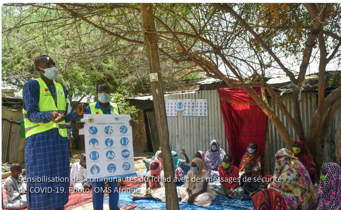
Sensibilisation des communautés du Tchad avec des messages de sécurité de COVID-19.