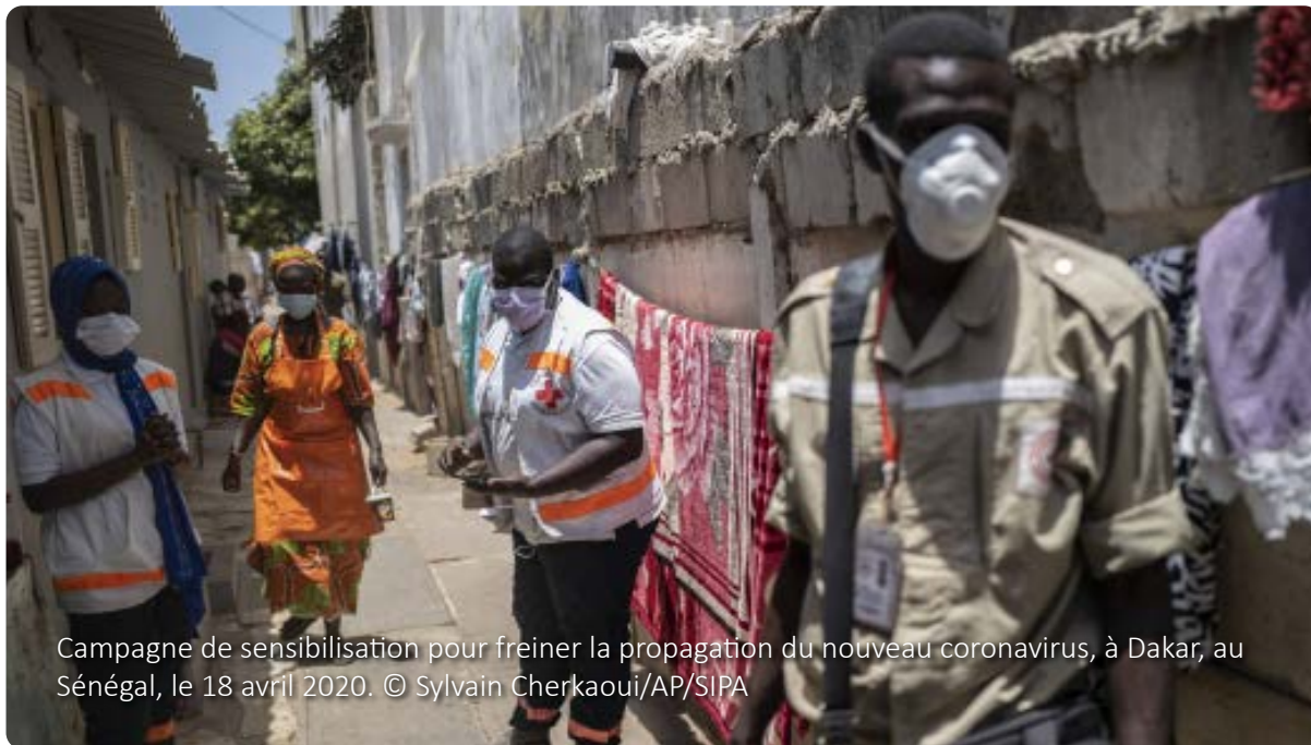
Campagne de sensibilisation pour freiner la propagation du nouveau coronavirus, à Dakar, au Sénégal, le 18 avril 2020.