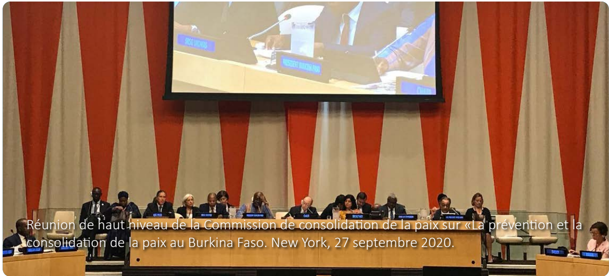
Réunion de haut niveau de la Commission de consolidation de la paix sur «La prévention et la consolidation de la paix au Burkina Faso. New York, 27 septembre 2020.