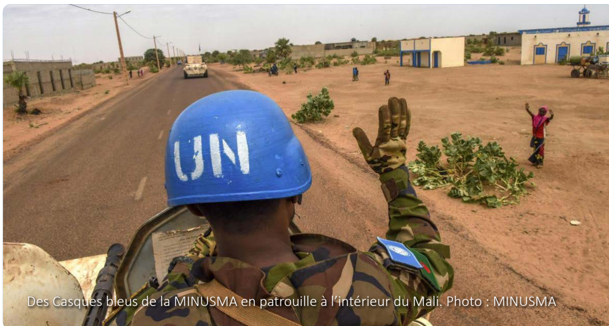
Des Casques bleus de la MINUSMA en patrouille à l'intérieur du Mali.